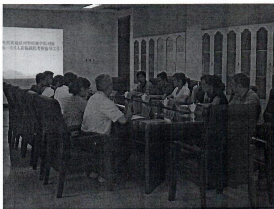
2014 年 钦州学院来访