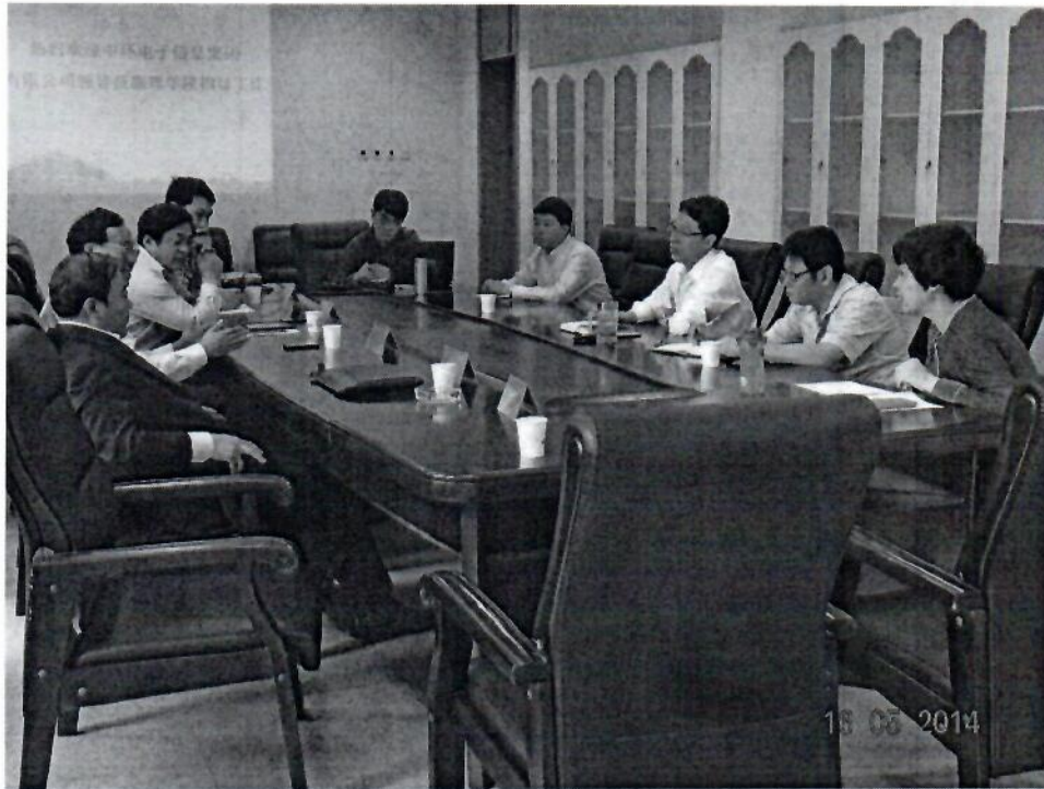
2014.5 天津中环电子信息集团来我院来访